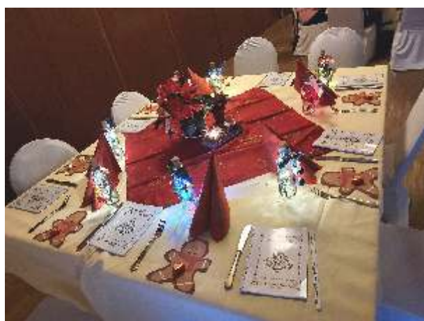
Tischdekoration der Frauenweihnachtsfeier