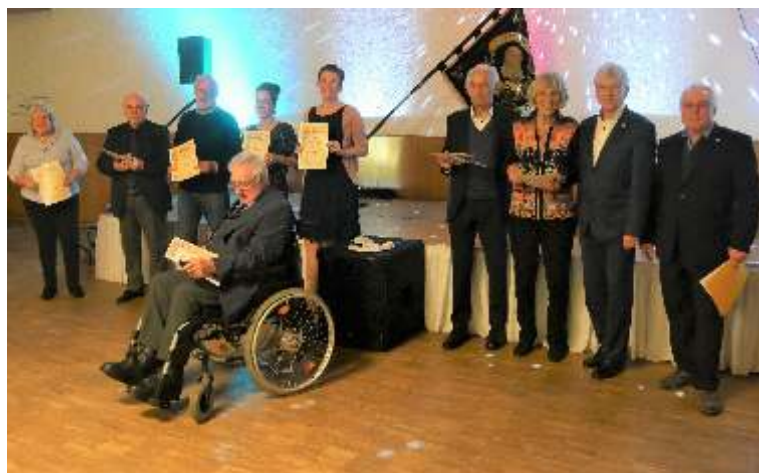
Jubilare auf dem Stiftungsfest